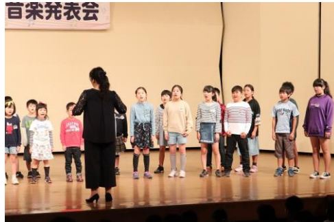
全校合唱(市小中学校音楽会)