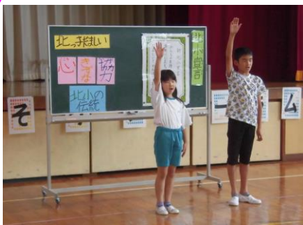
いじめをなくそうフォーラム