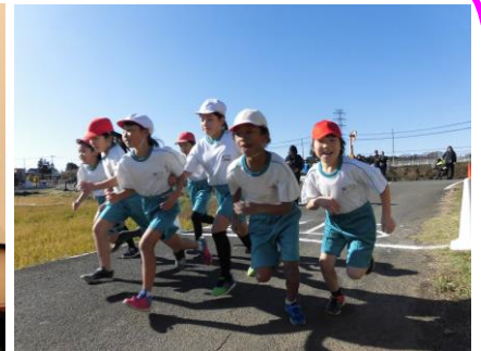
校内持久走記録会