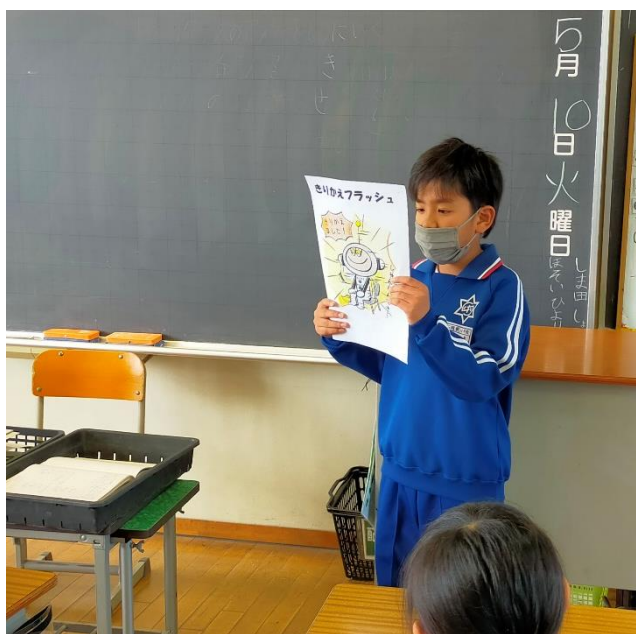
写真：環境福祉委員が毎週読み聞かせています。