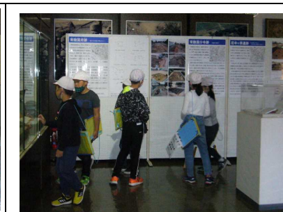
資料館の掲示物にも興味津々