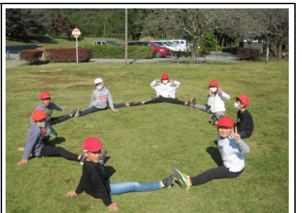
青空の下、芝生でリラックス！