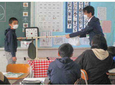
体験を通して学習の確認を！