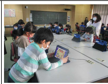
かけ算の確認にICTを活用