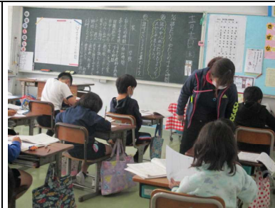
分からない所は先生に質問！