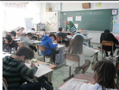
課題に熱心に取り組んでいます

まだまだコロナの終息が見えずに、保護者の方が来校できる機会が限られているのが現状ではありますが、今後とも、子供たちの「輝くひとみ」のために、ご協力をどうぞよろしくお願いいたします。