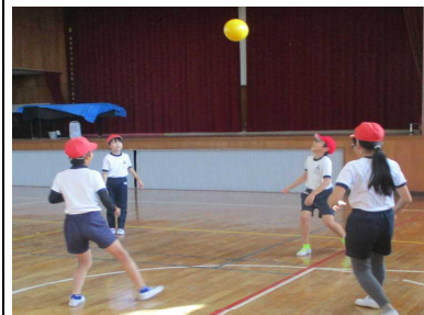
体を動かすのはやはり楽しい！