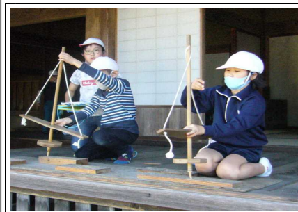
昔の道具に四苦八苦。難しい！