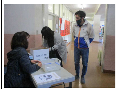
受付のご協力に感謝です