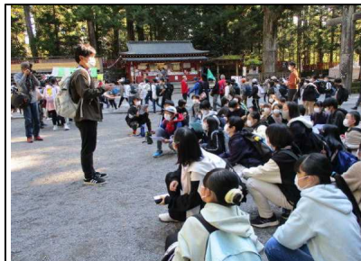
観光客がいっぱいでしたが、担任の話はしっかりと聴きます！

東照宮見学の後は、日光だいや川公園へ移動し、晴天の中、お弁当を食べました。とても広い芝生の上で、子供たちはとても気持ち良さそうでした。食後はレクリエーションで体を動かし、仲間と楽しい時間を過ごしました。全員そろって、小学校最後の遠足を満喫でき、最高学年としてもまたひとつ成長できた良い機会となりました。