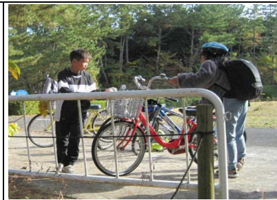
グループ毎のサイクリングでは、協力し合う姿が見られました。