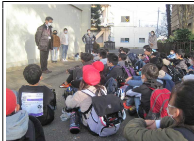
出発式で校長先生の話をしっかりりと聞きます。さすが高学年！

11月18日(木)に第5学年遠足として、国営ひたち海浜公園に行ってきました。10月の校外学習は雨天だったため、天候が非常に心配されましたが、秋晴れのとても清々しい1日でした。子供たちは、元気いっぱいグループでのサイクリング、おいしいお弁当タイム、楽しみなお買い物、大草原でのクラスレクと海浜公園での1日を満喫できたようです。後日、子供たちから「楽しかったから、家族で土日にもまた行ったよ。」といった話も聞くことができました。