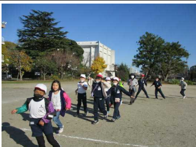
密を避けた「じゃんけん列車」。列を保ったままの移動です。