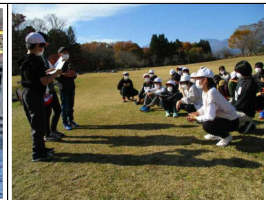
素晴らしい天気・景色のもと、レクリエーションも楽しみました。