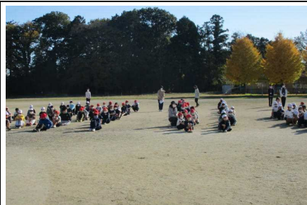
久々の集会でしたが、整列も聴く姿勢もバッチリでした。