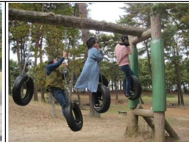
アスレチック広場では、思う存分、身体を動かしました。