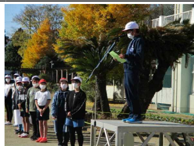
代表児童が、集会の目的をしっかりと伝えてくれました。

様々なレクリエーションを全校児童が共に行うなかで、ステキな笑顔がたくさんあふれた集会となりました。「コロナ禍で何ができるか」をしっかりと考え、計画・実施してくれた代表委員会児童の活躍ぶりにも感心した集会でした。