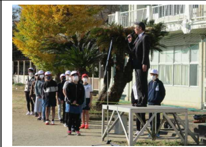
校長先生から、体育館脇の「7本のイチョ」のお話がありました。