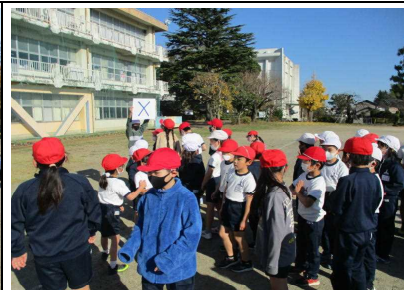
先生に関する〇×クイズでは、一問毎に、大盛り上がりでした。