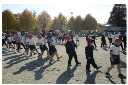
「白熊のジェンカ」では、みんなとても可愛らしく踊りました。