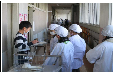
給食当番の健康チェックも一人一人確実にを行っています。