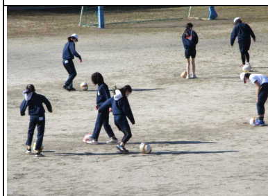
体育で身体を動かすのは、やはり気持ちがいいですね。