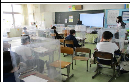
3・6年生の授業は、学級を2つに分けて実施しています。電子黒板等を活用し、同じ授業ができるようにしています。