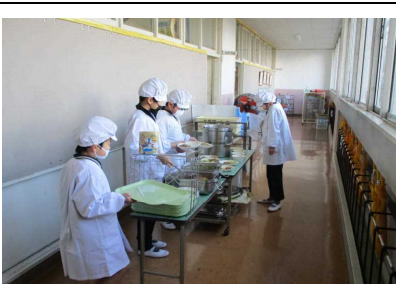
3・6年生の配膳は、密を避けるため廊下で行っています。