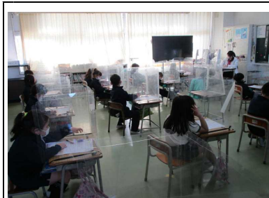
久しぶりの学校ですが、午後の授業も集中しています。

春もそこまで来ています。コロナに関する我慢も、もうすぐ開けることを期待しつつ、教職員・子供たちが一丸となり、前を向いて教育活動を行っていきたくと思ひます。