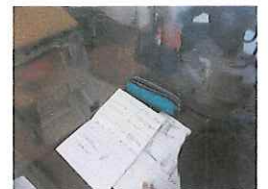
「ふるさと学習」では石岡かるた作りを行いました。