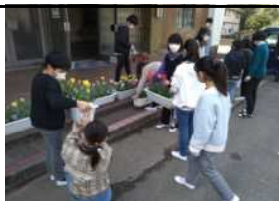
【会場準備に取り組む在校生】

入学式も、感染対策を講じての実施となりましたが、新入生を温かく迎え入れようという在校生、教職員の思いが、たくさん詰まった式となりました。