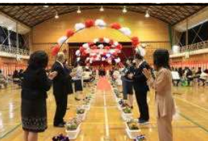
【職員によるアーチ】

新型コロナウイルス感染症の終息が未だ見えない状況です。本年度も、学校行事や諸活動につきましては、感染予防対策を十分に考えながら対応していきます。引き続き、保護者の皆様のご理解・ご協力をよろしくお願いいたします。