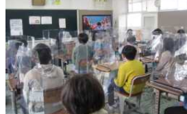
【オンラインでの始業式】