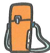
おおいぶん タめの水分