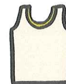
いんなあ ちやくよう インナー着用