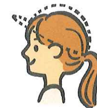
なが 長いかみはむすぶ