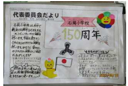
【アルミ缶回収を呼びかける代表委員会だより】

学校では、先ほど紹介した「アルミ缶回収」をはじめ、11月には、全児童で「石小」という人文字を校庭に描き、記念の航空写真を撮影します。また、各授業においても、校歌の歌詞を読み取り歌ったり、今の石岡小学校の風景を絵画に表したり、150周年という石岡小の歴史と伝統の重みを感じながら学習を進めています。保護者の皆様にも、様々な機会を通して、ご覧いただければと思います。