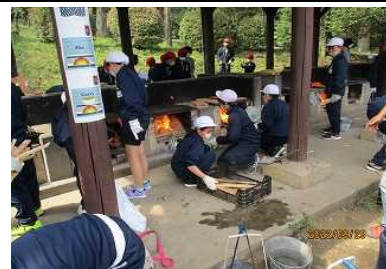
火起こしも協力して順調に進み、杉の木を焼き上げました。