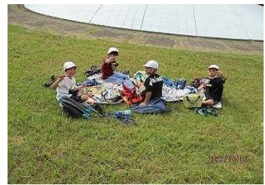
青空の下、心のこもったお弁当をみんなでおいしくいただきました。