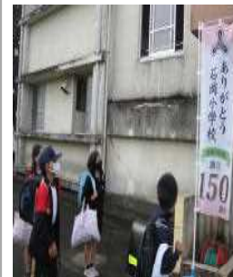
【150周年を祝うのぼり】【ふきぬけ通路に設置された回収ボックス】

なお、PTA本部役員の皆様を中心に回収ボックスを作成していただき、ふきぬけ通路に設置しました。早速、子供たちが、アルミ缶を持ってくるとボックスに投かんし、順調に回収が進んでおります。