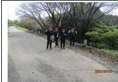
豊かな自然の中で、グループで協力して山ビンゴにチャレンジ！

感染症対策を行ったうえでの遠足であり、制限はあったものの、子供たちが笑顔いっぱいたくさん思い出をつくることのできた様子でした。保護者の皆様にも、様々なご協力をいただき、ありがとうございました。