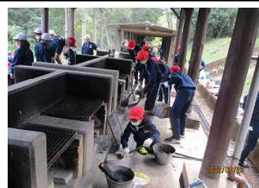
かまどの清掃の徹底ぶりにお褒めの言葉をいただきました。