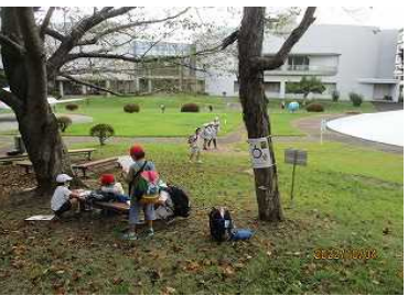
地図記号クイズラリー。社会科の学習を生かして解き進めました。