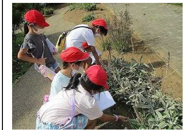
筑波実験植物園では、ミッションクリアめざし団結力を発揮