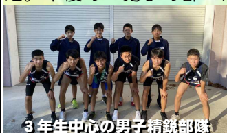
3年生中心の男子精鋭部隊