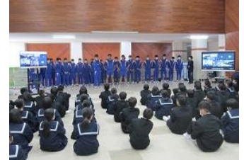
対面式・新入生歓迎会