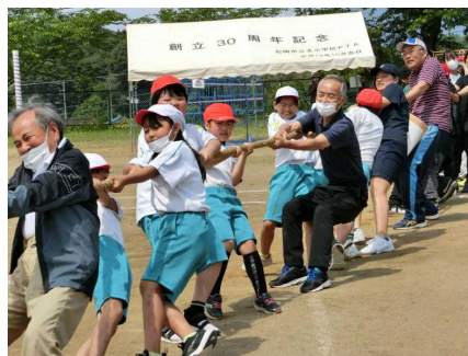
地域の皆様も一緒に綱引き