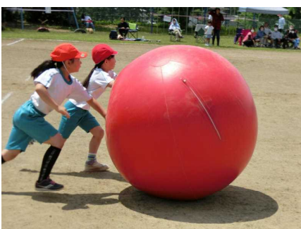
「大だま大作戦」(全児童)