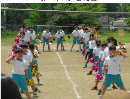
Snow Manの曲にのってポーズ♪