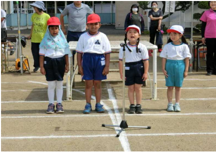
1年生のあいさつで運動会がスタート

5月27日(土)、運動会を実施しました。晴天に恵まれ、校庭には、1位を目指して最後まで走り切る姿、赤組・白組のために必死で応援する姿、心を一つに体いっぱいダンスを踊る姿等、笑顔と歓声があふれていました。応援いただいた保護者・卒業生・地域の皆様、ありがとうございました。