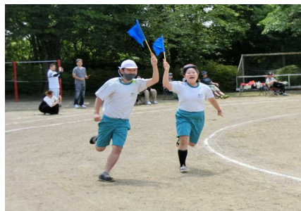
「どれにしようかな! ?」(4～6年生)