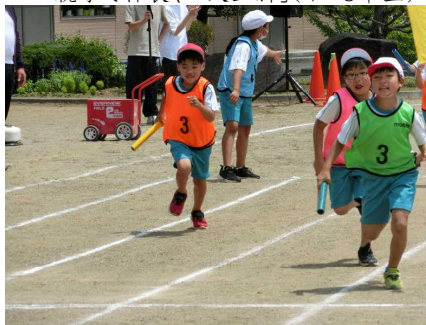
赤白対抗全校リレー