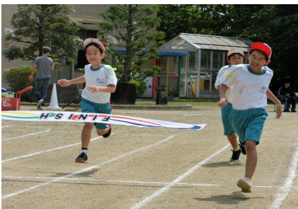
「走れ北っ子 2023 !!」(4～6年生)