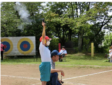
出発係 緊張の一瞬