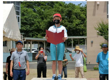
結果発表 1点差で白組の勝ちでした!