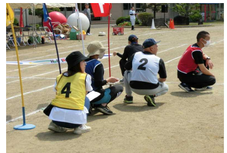
係の補助ありがとうございました