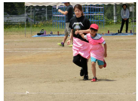
「親子で でかばん」(1～3年生)