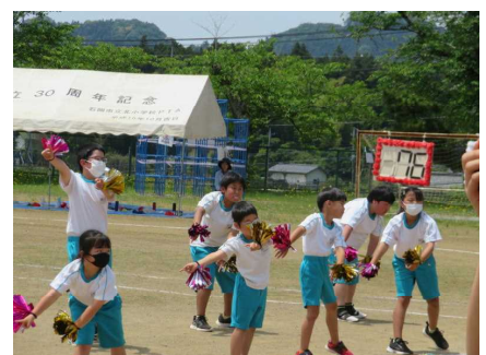
全校ダンス「ノーサレンダー」