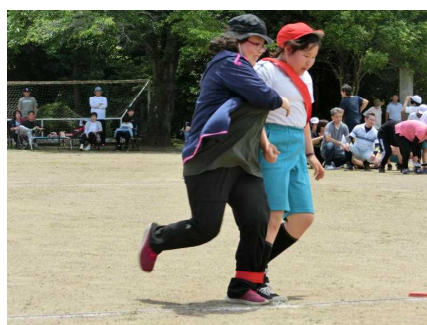
「親子で仲良く二人三脚」(4～6年生)