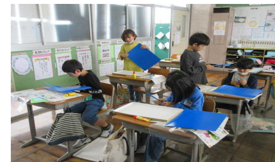
図工 コロコロガーレ制作