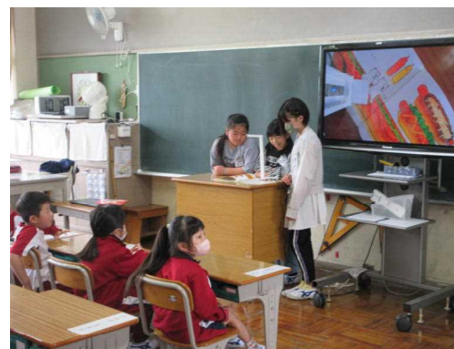
本係による1年生への読み聞かせ