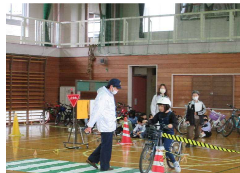
5月23日 交通安全教室