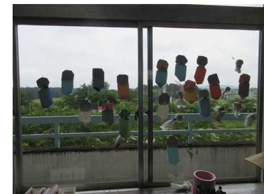
「遠足の日 晴れますように！」