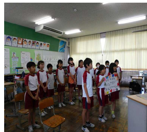
6月21日(水) 校内いじめ防止フォーラム