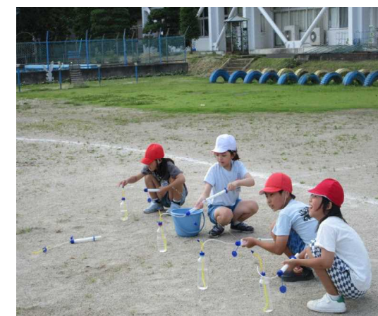
6月19日(金) 理科の実験「とじこめた空気と水」