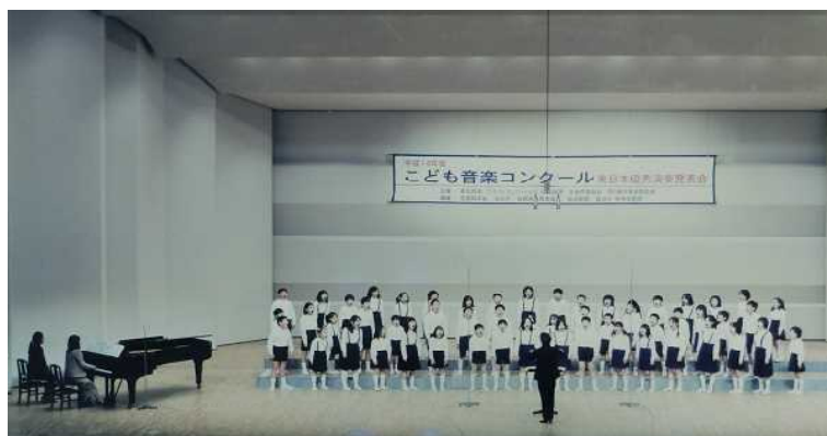
平成14年(2002年)TBSこども音楽コンクール東日本大会優秀賞