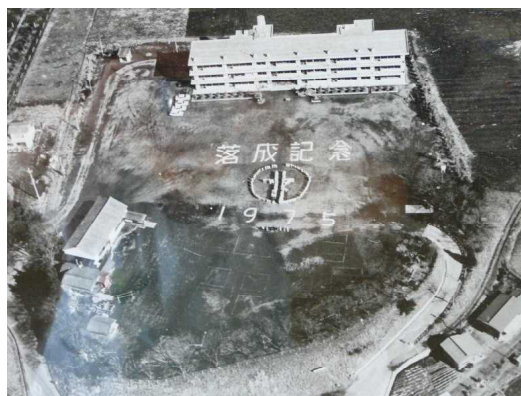
昭和50年(1975年)校舎落成記念の航空写真