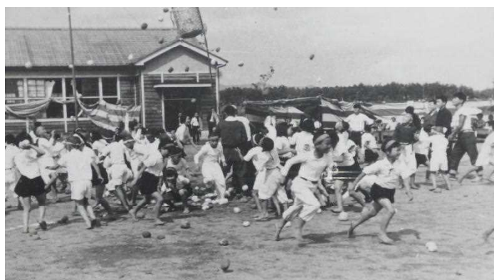
根当分校建設当時の運動会の様子 はだしですね！

閉校まであと半年。「すべては子どもたちのために」を合言葉に、保護者、地域の皆様に支えていただきながら、充実した教育活動の推進に努めて参ります。