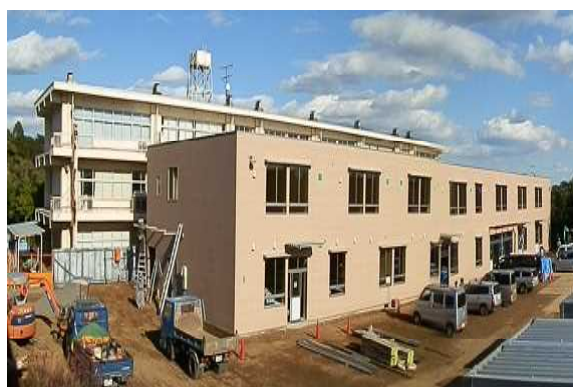
平成25年(2013年)現在の校舎建設時当時の様子