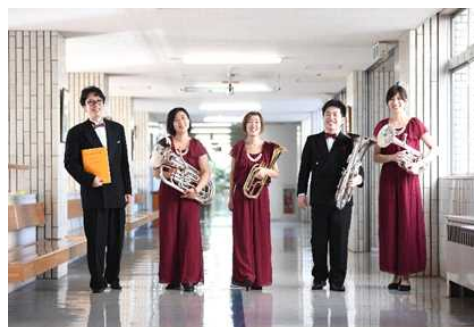
カント・オリエンテの皆さん