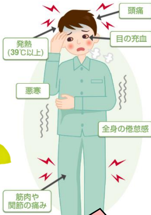
[インフルエンザの主症状]

インフルエンザの感染経路は、感染患者の咳やくしゃみなどのしぶきに含まれるウイルスを吸い込む「飛沫感染」が主です。体内に入り込むと急激に増殖していきます。