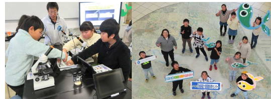
【生物の観察の様子】

11月21日(火)に、3・4年生が環境学習の一環として、霞ヶ浦環境科学センターを訪れました。施設の方から、霞ヶ浦の水質や生物について説明していただき、顕微鏡やパソコンを活用して観察しました。初めて見る生物も実際に観察することができ、普段ではなかなかできない貴重な体験となりました。