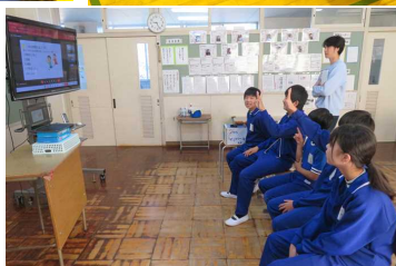
【交流会の様子(6年生はオンライン)】