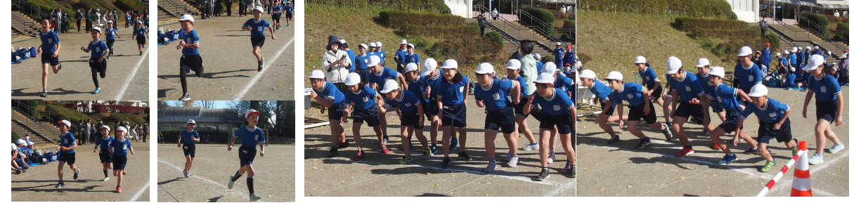
【低学年の走る様子】

12月1日(金)に、持久走大会を開催いたしました。今年の冬は、例年よりも暖かかったので、たくさん練習することができました。また、当日は、家族の方が応援に来てくださり、練習のときよりも力強い走りことができました。関川小学校での持久走大会は、今回が最後となりますが、南小学校・石岡中学校へ行って体力向上に励み、また、力強い走りを見せてほしいと思います。応援、ありがとうございました。