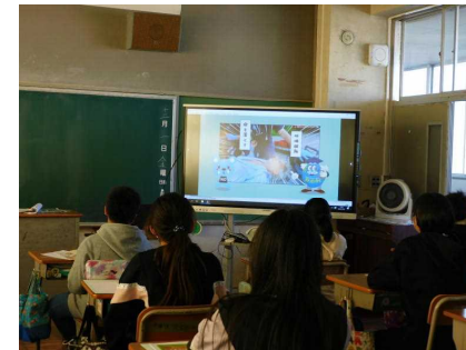
「薬物乱用防止教室」